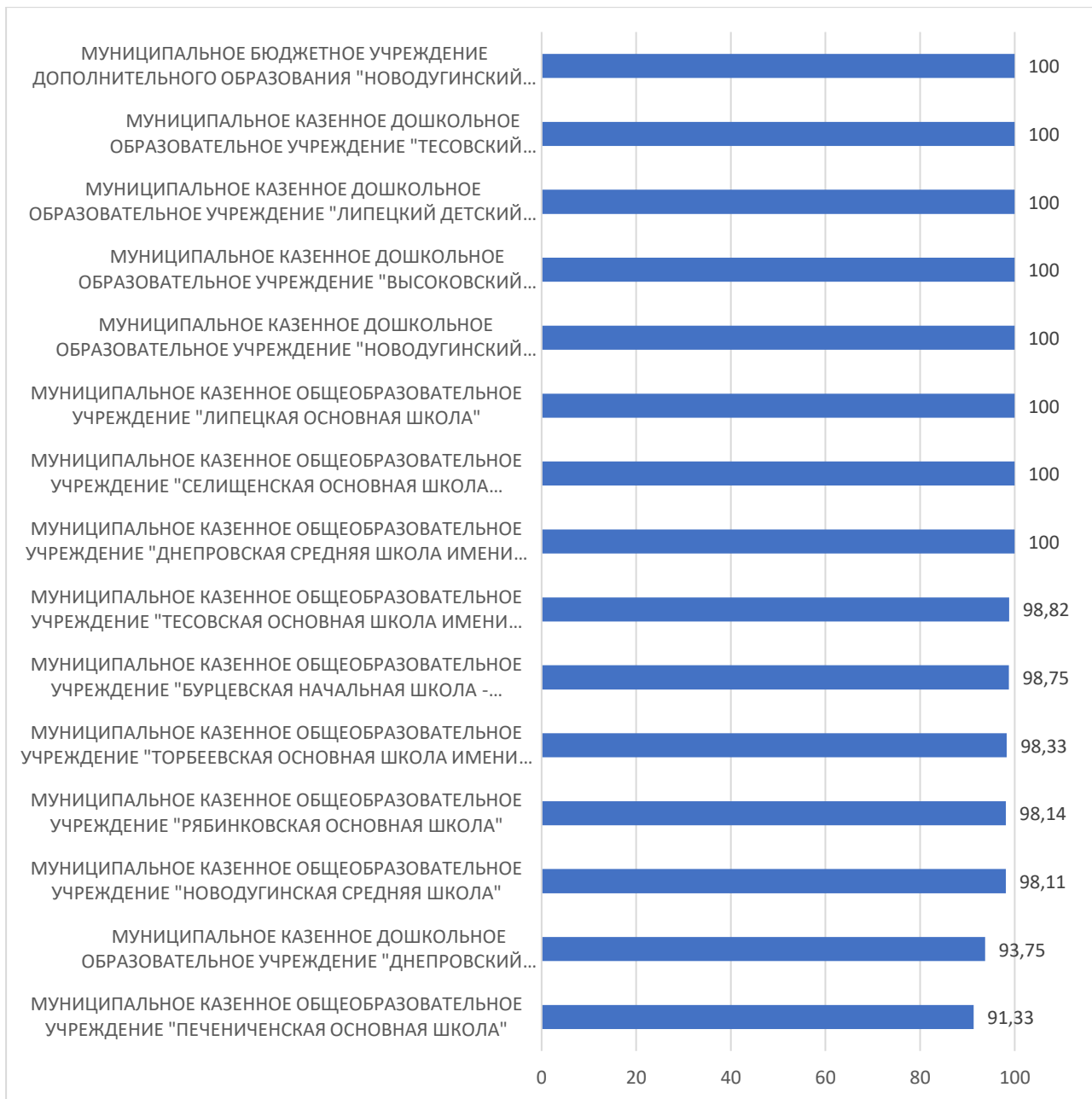
Рисунок 5 – Рейтинг организаций по критерию «Удовлетворенность условиями осуществления образовательной деятельности организаций»