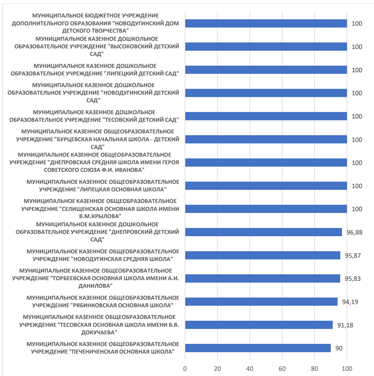
Рисунок 2 – Рейтинг организаций по критерию «Комфортность условий, в которых осуществляется образовательная деятельность»

По второму критерию «Комфортность условий, в которых осуществляется образовательная деятельность» максимальный результат 100 баллов набрали: