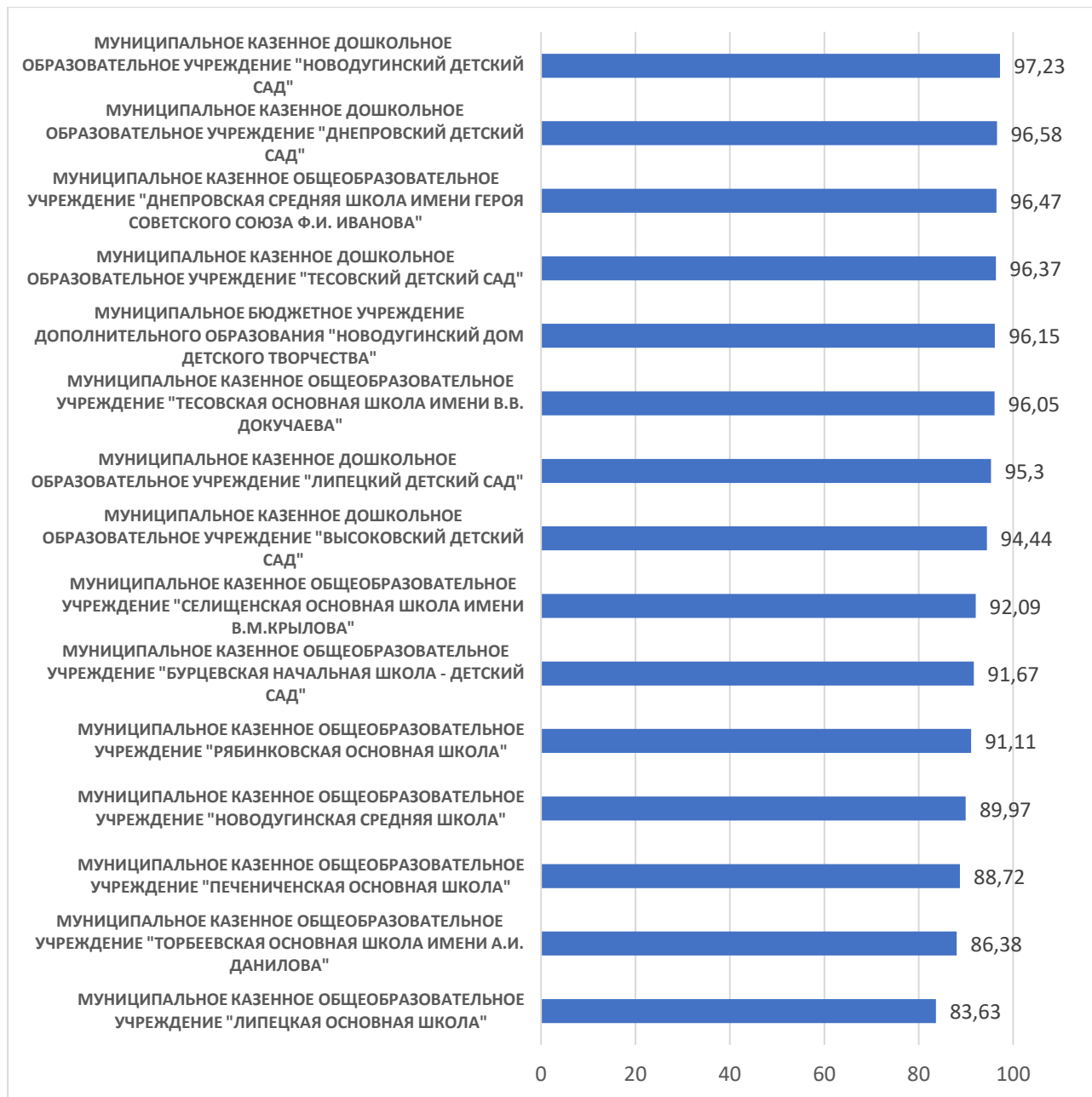
Рисунок 1 – Рейтинг организаций по критерию «Открытость и доступность информации об организации, осуществляющей образовательную деятельность»